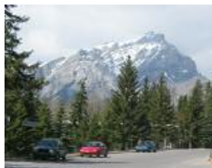
Vue depuis le Centre

La cérémonie de remise des Prix et le Banff Centre ont également reçu des avis extrêmement favorables de la part des participants, tout particulièrement en ce qui concerne la nourriture servie! Il y a eu de nombreux commentaires sur les possibilités offertes d'entrer en contact et d'établir des liens avec les collègues, un grand enthousiasme quant à l'intérêt pédagogique du contenu et aux idées nouvelles et un sentiment général d'avoir vécu une formidable expérience.