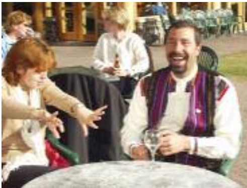
Sous le soleil lors du barbecue à l'extérieur du banquet de remise des Prix d'excellence