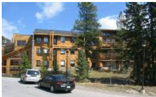
Le Banff Centre

Cette année, la conférence s'est tenue au Banff Centre, à Banff en Alberta. Si vous vous êtes déjà rendu à Banff, vous savez combien ce lieu est beau avec son ciel clair, ses montagnes, ses forêts et sa faune sauvage omniprésente. Le Banff Centre nous a offert un cadre sans prétention, parfait pour se mélanger aux autres et pour apprécier le panorama et la conférence.