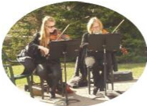
Les musiciennes de Duo Rouge lors du gala