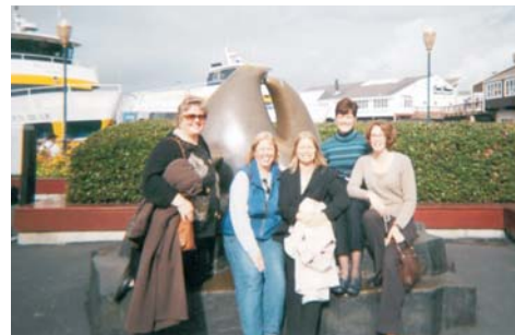
Les infirmières de l'ACIIS jouent les touristes à San Francisco.